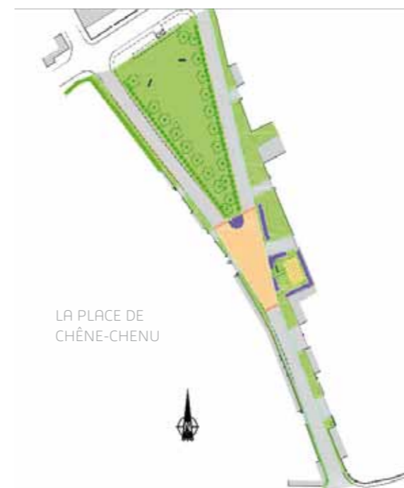
LA PLACE DE CHÊNE-CHENU

Le PLU sera également disponible sur le site Internet de la commune WWW.TREMBLAYLESVILLAGES.COM à partir du 15 janvier.