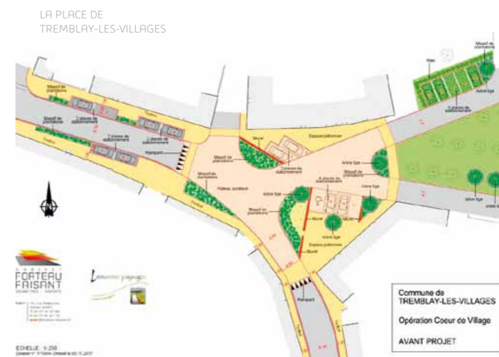
LA PLACE DE TREMBLAY-LES-VILLAGES