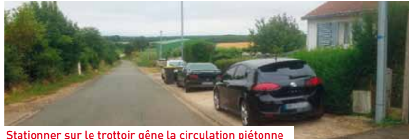
Stationner sur le trottoir gêne la circulation piétonne

Piétons et cyclistes sont considérés comme des usagers de la route à part entière et l'absence de protection les rend d'autant plus vulnérables. La sensibilisation des enfants dès leur plus jeune âge apparaît toujours comme le meilleur moyen d'éviter les accidents.